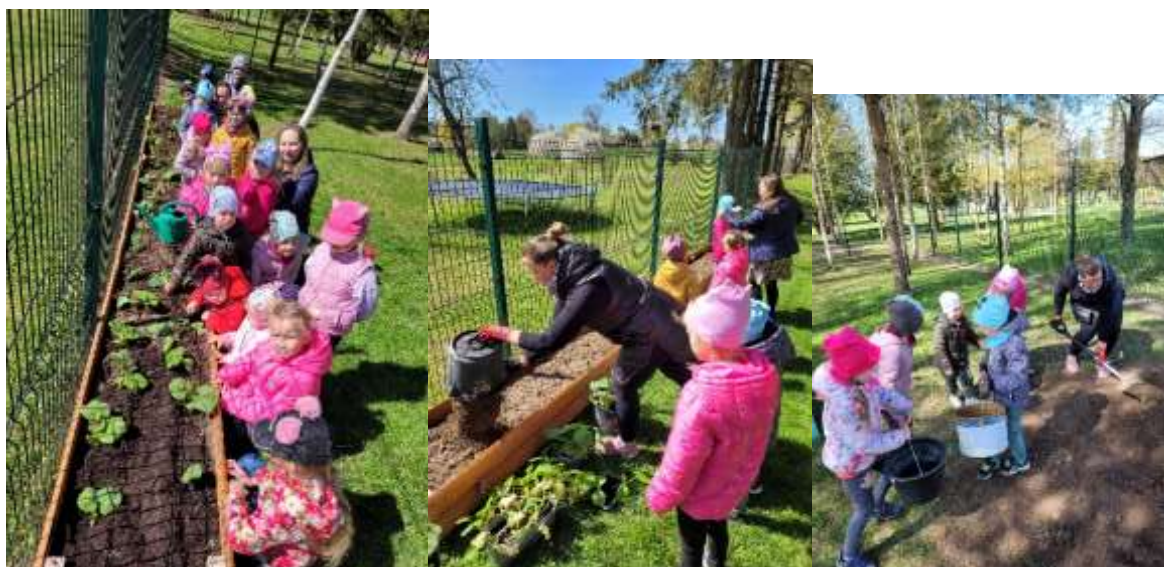
uUgdytiniai sodino savo grupės daržo lysvę

Pavasario veiklų pradžia – darželio Eko moliūgų lysvės įsirengimas. Grupėje ir namuose vaikai daigino moliūgus, kartu su tėveliais juos persodino į lysvę